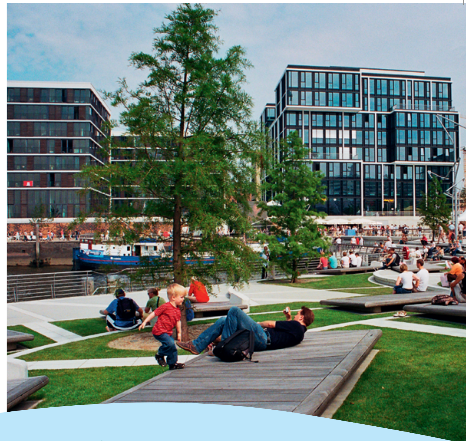
ECO Rain® Root Zone – Zavlažovací rohože

Rohože ECO Rain® Root Zone Irrigation Mat byla vyvinuta ve spolupráci s výzkumnými institucemi a špičkovými společnostmi v oboru závlahových technologií. Nově založená společnost ECO Rain® International se intenzivně podílí na dalším vývoji, výrobě a distribuci těchto moderních technologií závlahových rohoží. Základním faktorem úspěchu značky ECO Rain® International je vysoká úroveň teoretických i praktických znalostí z vývoje i výroby moderních textilních materiálů, stejně tak jako širokého spektra závlahových technologií.