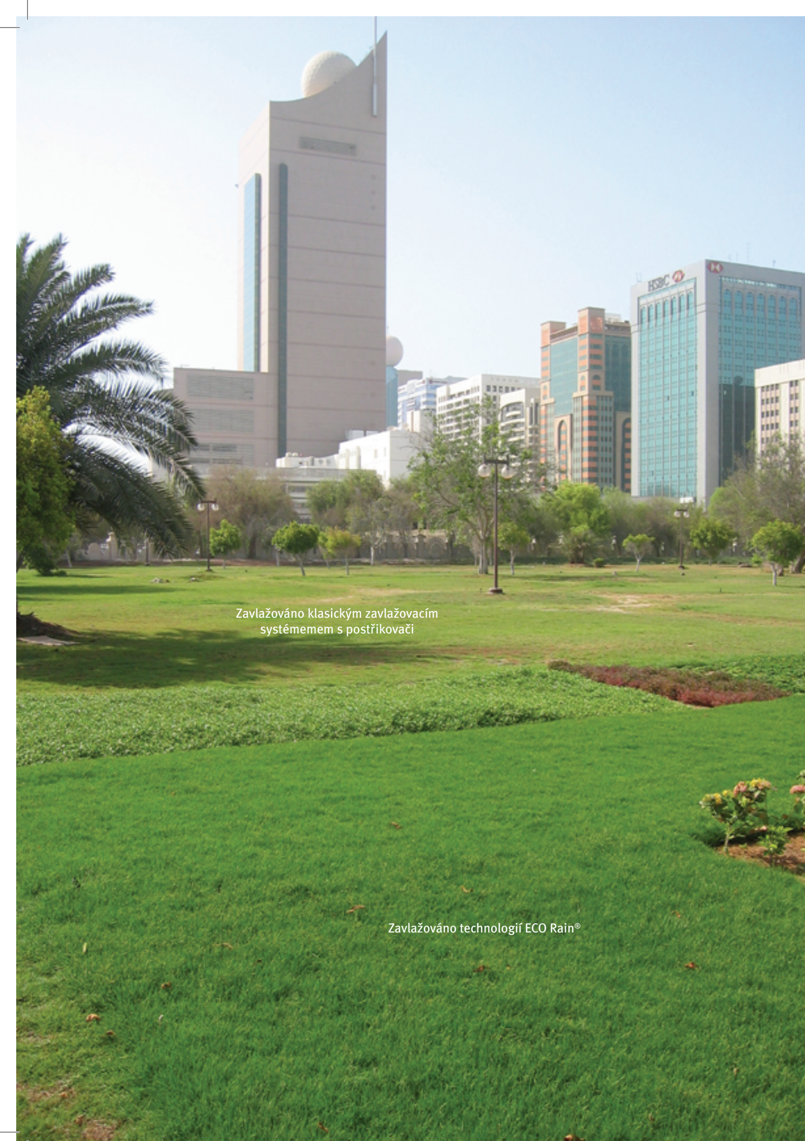
Zavlažováno klasickým zavlažovacím systémem s postřikovači