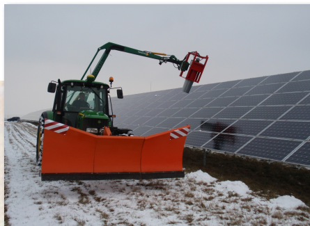
Model Buffalo Cyclone PTO nesený za traktor.