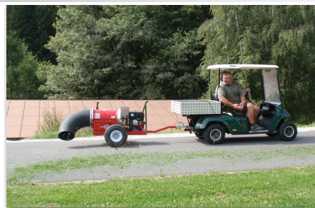
Tažená verze fukaru Buffalo Cyclone 8000 při údržbě cyklostezek a in-line drah. Fukar Buffalo Cyclone s hydraulickým pohonem při odklízení sněhu.